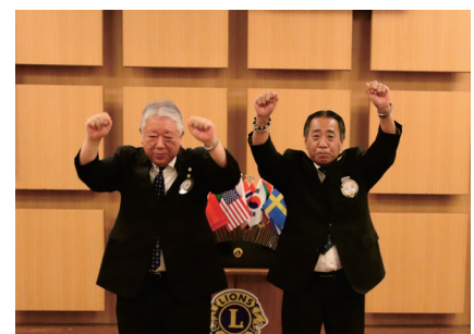
ライオンズローア